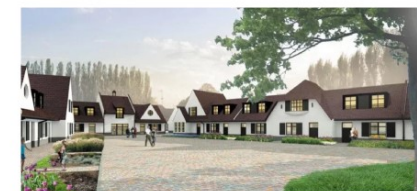
« Béguinage » - Rue Gabriel Péri - Bondoues

Le site actuel est particulièrement arboré. Les alignements d'arbres en limite de parcelle devront être conservés voir renforcés afin de garantir une insertion paysagère de qualité au sein du paysage communal. Une place verte publique synonyme de création de lien social sera aménagée au centre de l'opération. Le maillage doux et son paysagement permettra de créer des aérations transversales au sein du projet. La végétalisation sera réalisée avec des essences locales. Les traitements des surfaces bâties seront le plus intégrés possible (matériaux d'aspect naturels type bois et pierre).